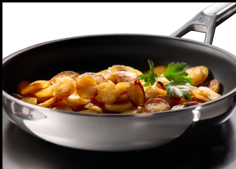
Krosseste Bratergebnisse dank hervorragender Wärmedurchlässigkeit von UniverSUS®.