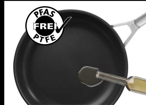
Aktivierbarer natürlicher Antihafteffekt, der durch die Zugabe von Speiseöl immer wieder erneuert wird.