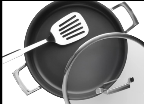
Metallwender möglich dank extrem harter und kratzfester UniverSUS®-Oberflächenstruktur.